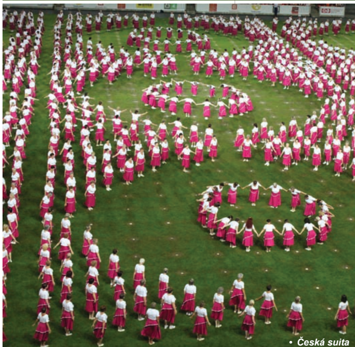
• Česká suita