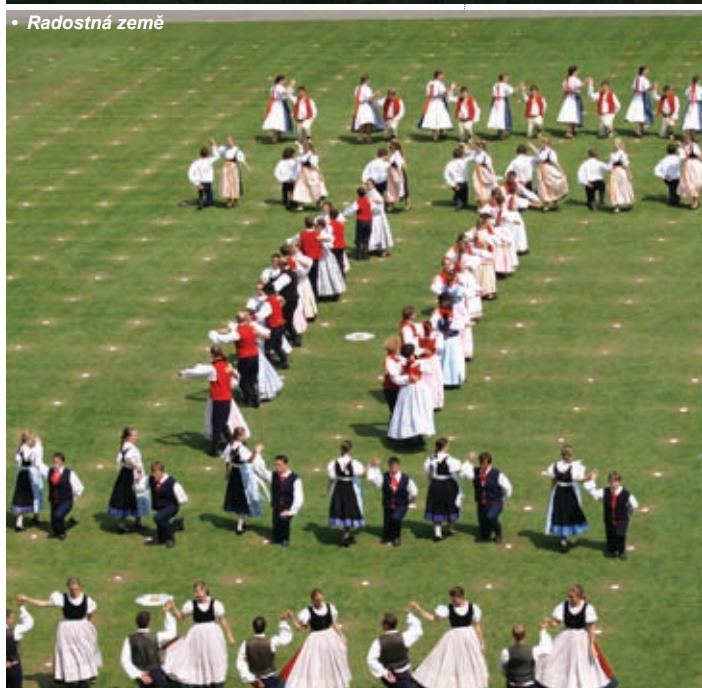
• Radostná země