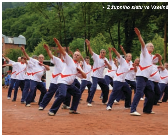
• Z župního sletu ve Vsetíně