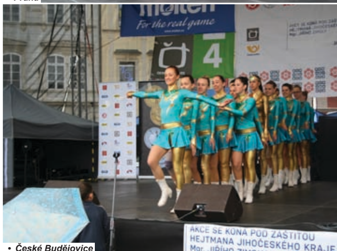
• České Budějovice