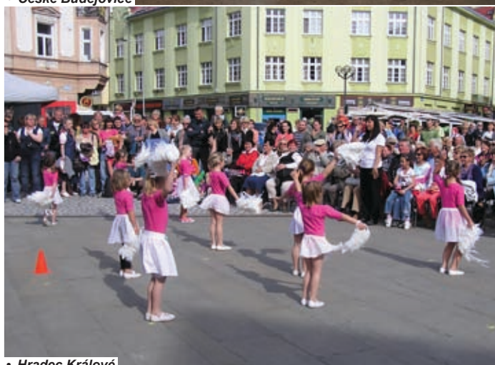
• Hradec Králové