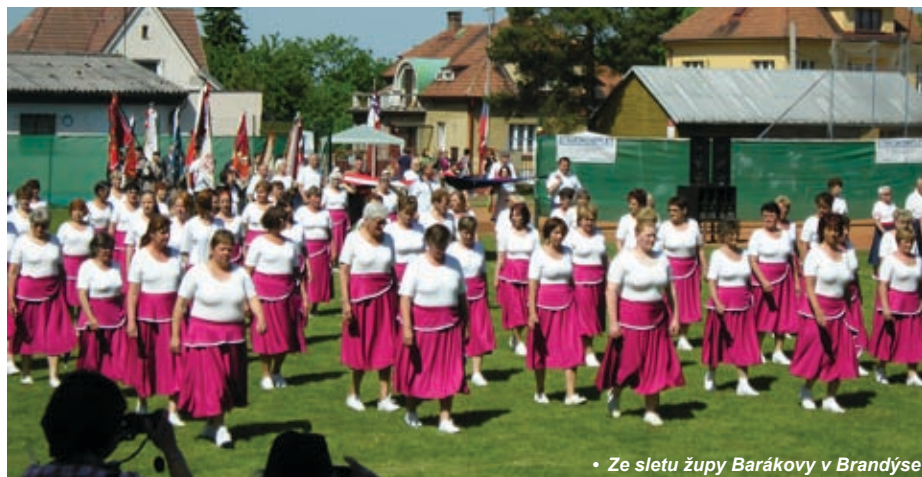
• Ze sletu župy Barákovy v Brandýse

Všem, kteří nám do redakce zaslali příspěvky a fotografie ze svých župních a krajských sletů, děkujeme. Zároveň prosíme všechny župy, od nichž ještě sletové fotografie nemáme (a těch je většina), aby nám je zaslaly pro použití ve sletovém památníku, v němž chceme zachytit i všechny slety, odehrávající se v regionech naší republiky.