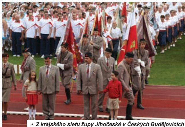
• Z krajského sletu župy Jihočeské v Českých Budějovicích

Sokolská župa Barákovy a Tělocvičná jednota Sokol Brandýs nad Labem na počest 150. výročí založení sokolské organizace a XV. všesokolského sletu uspořádala v sobotu 19. května župní sokolský slet v Brandýse nad Labem-St.Boleslavi na sokolském