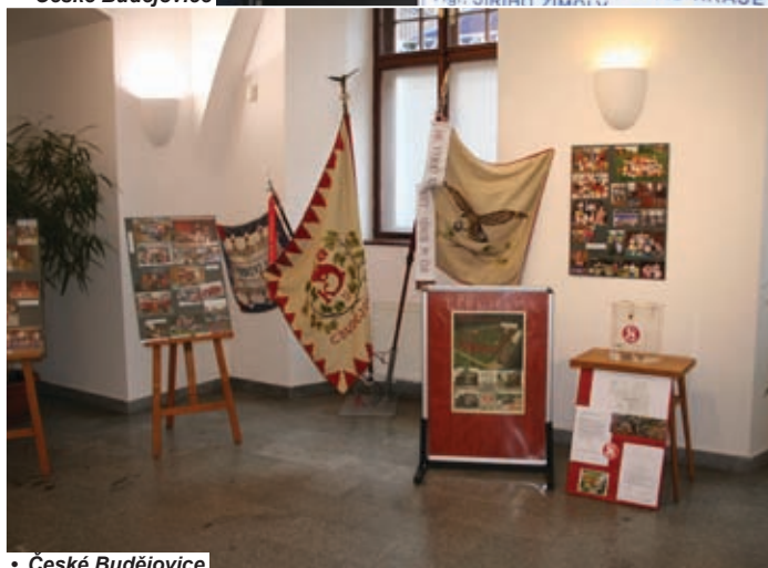
• České Budějovice