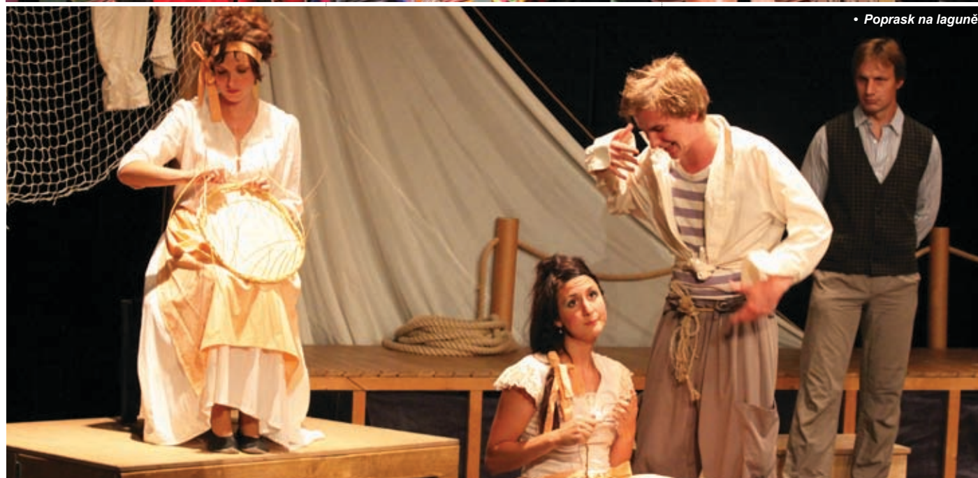
• Poprask na laguně