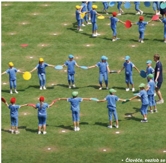
• Člověče, nezlob se