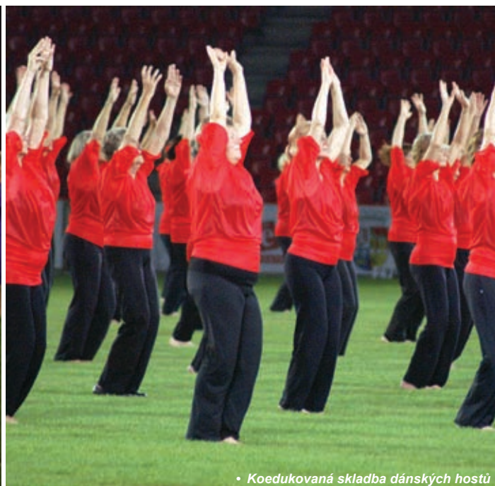
• Koedukovaná skladba dánských hostů