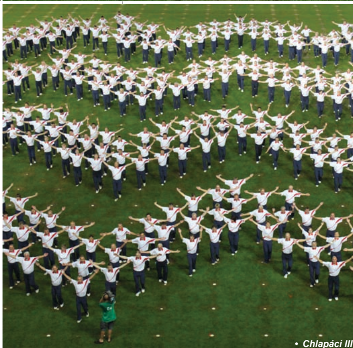
• Chlapáci III