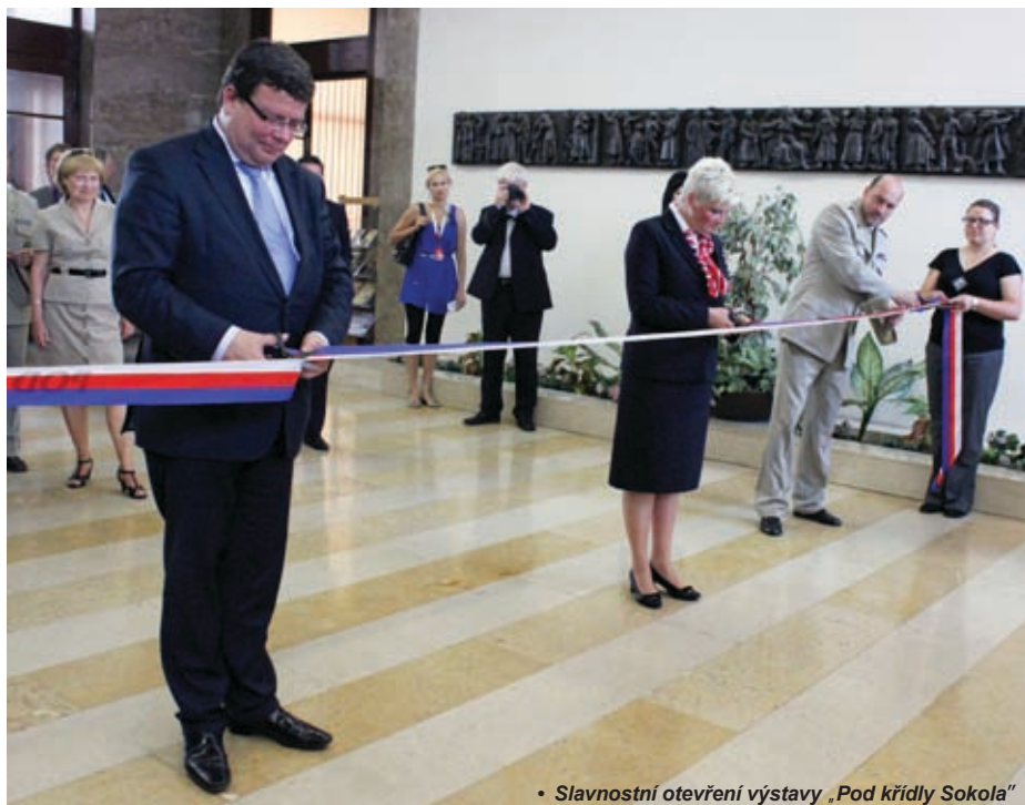
• Slavnostní otevření výstavy „Pod křídly Sokola“

Výstava ukazuje vedle tělocvičné historie i linii vojenskou. Význam propojení Sokola s historií československých a českých ozbrojených sil také ve svém projevu zdůraznil ministr obrany Alexandr Vondra, který citoval známý výrok prezidenta T. G. Masaryka „Bez Sokola by nebylo legií, bez legií by nebylo Československo“. Výstava „Pod křídly Sokola“ je v Armádním muzeu Žižkov otevřena každý den kromě pondělí od 10.00 do 18.00 hodin. Výstava potrvá až do roku 2013 a vstup je zdarma.