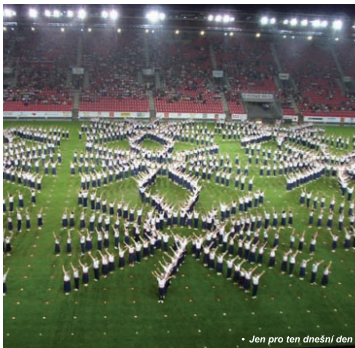
• Jen pro ten dnešní den