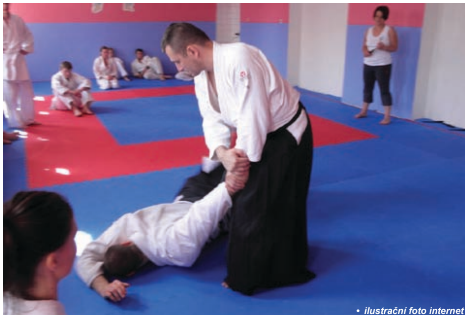
• ilustrační foto internet

Sportovní hala Sokola Písek zažila koncem května premiéru – poprvé se zde konala celorepublikově významná soutěž v Allkampf-jitsu, kterou bylo 16. otevřené mistrovství České republiky v Allkampf-jitsu. Na třech zápasíštích se zde utkalo více jak sto závodníků z celé České republiky, a v to v dětských, juniorských i dospělých kategoriích. Soutěžilo se ve třech disciplínách, a to Rendori - secvičený boj dvou soupeřů, Kata - sestava technik cvičených jedním zápasníkem a Tamešivari, což obnáší přerážení