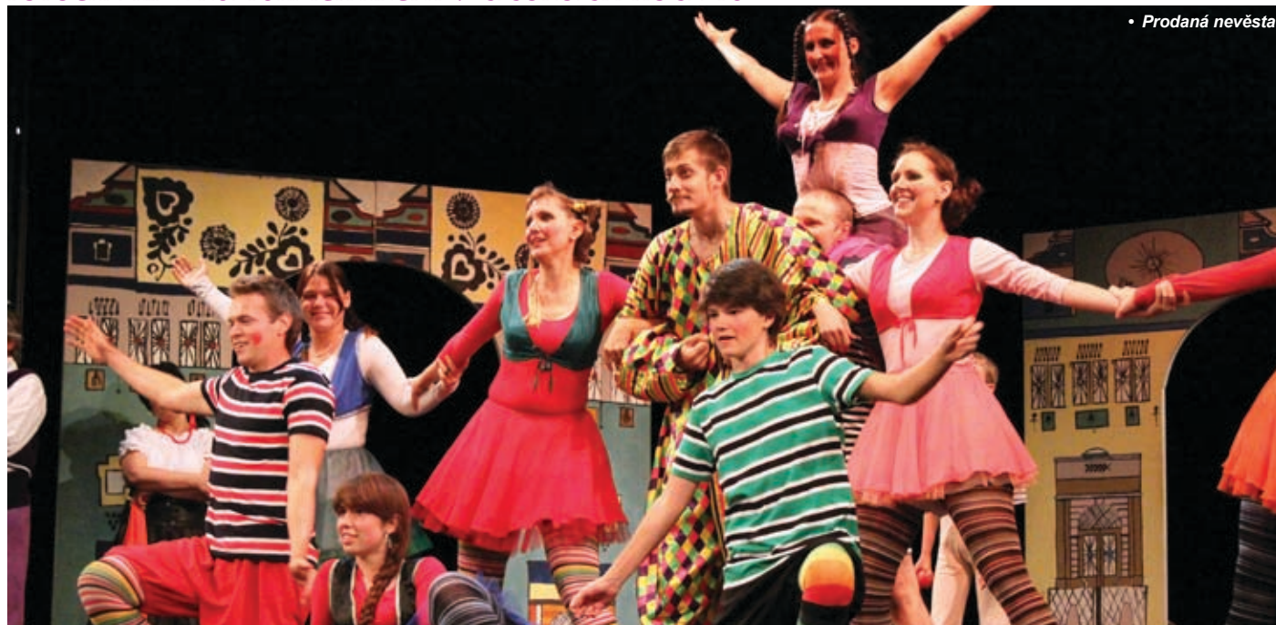
• Prodaná nevěsta