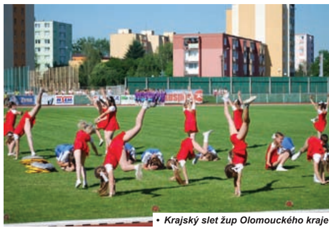
• Krajský slet žup Olomouckého kraje

Župa Fügnerova uspořádala župní slet poprvé v historii v Benátkách nad Jizerou, a to 5. května v městské hale. Pro naše město a především cvičence jednoty to byl opravdu velký svátek, vždyť jsme měli možnost jako jedna z prvních jednot prověřit připravenost na XV. všesokolský slet v Praze. Všichni jsme prožívali jistou nervozitu jak tuto generálku zvládneme, dobrá organizace členů be-