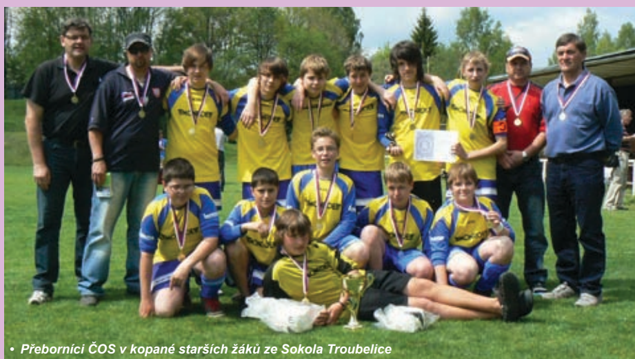
• Přeborníci ČOS v kopané starších žáků ze Sokola Troubelice

Oddíl kopané Sokola Bedřichov letos slaví 90. výročí svého založení. I to byl zřejmě jeden z důvodů, proč přebor ČOS v kopané starších žáků pro rok 2012 se v první polovině května konal na jeho hřišti v Jihlavě. Celý přebor se konal jak v rámci tohoto bedřichovského výročí, tak především v rámci 150. výročí vzniku Sokola.