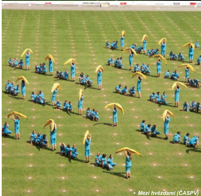
• Mezi hvězdami (ČASPV)