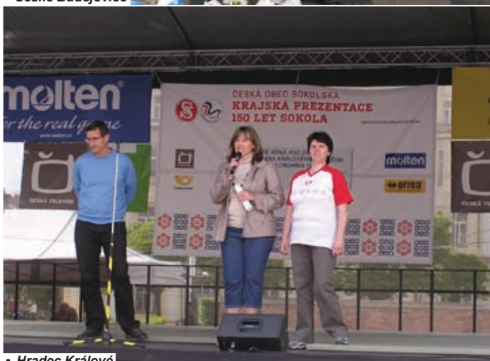
• Hradec Králové