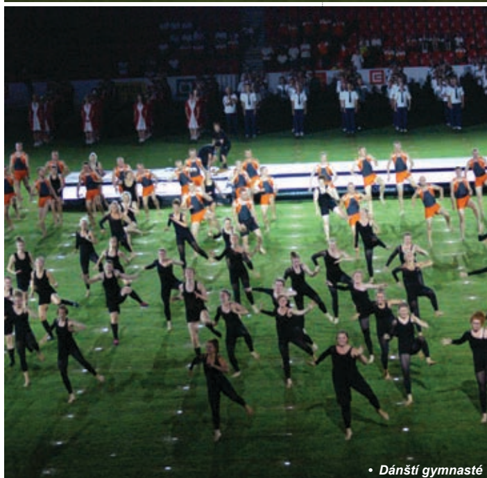
• Dánští gymnasté