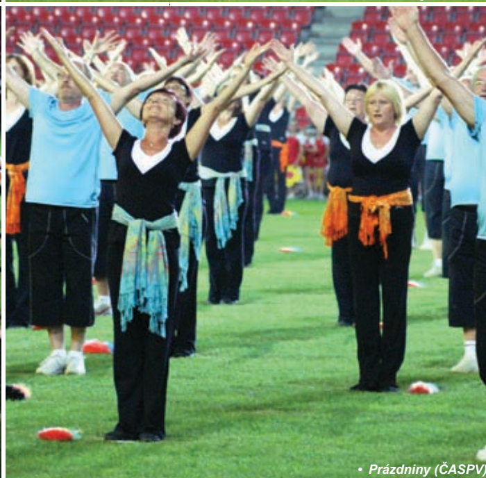
• Prázdniny (ČASPV)