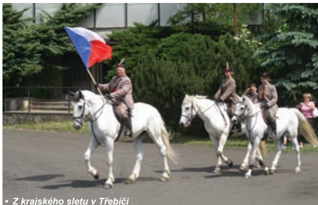
• Z krajského sletu v Třebíči

nátecké jednoty, nástupy, perfektní zvuk, fotografové, kameramani a radost z pohybu předčila naši obavu.