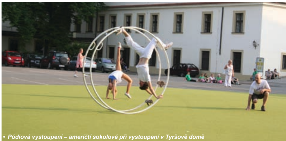
• Pódiová vystoupení – američtí sokolové při vystoupení v Tyršově domě