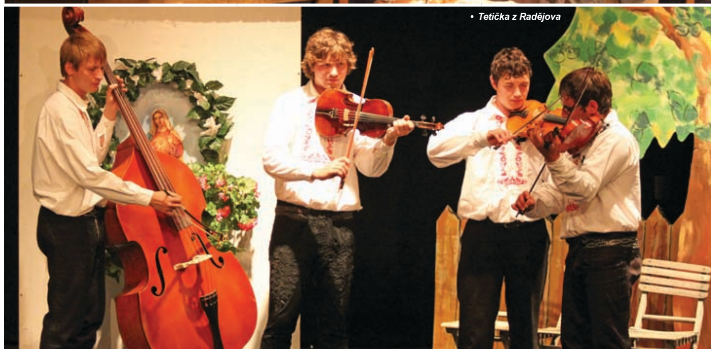
• Tetička z Radějova