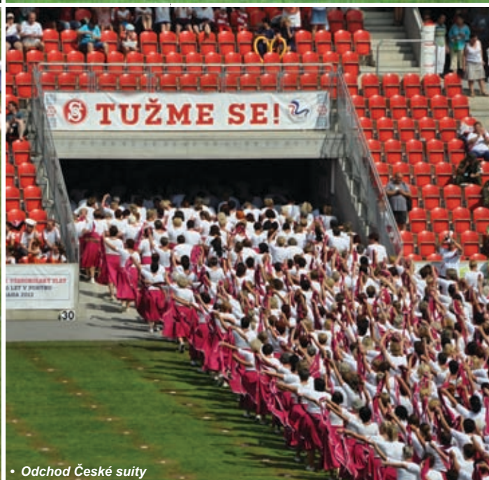
• Odchod České suity