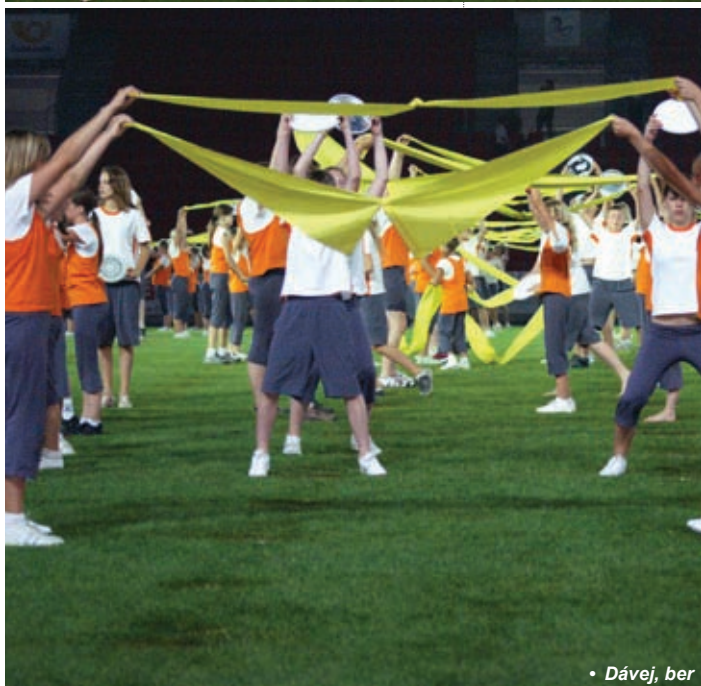
• Dávej, ber