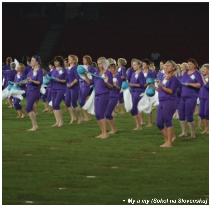
• My a my (Sokol na Slovensku)