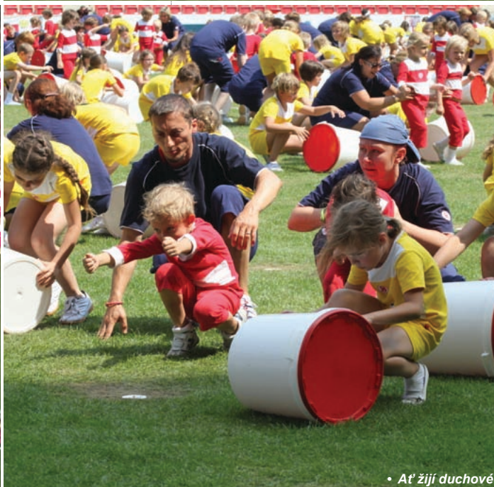
• Ať žijí duchové