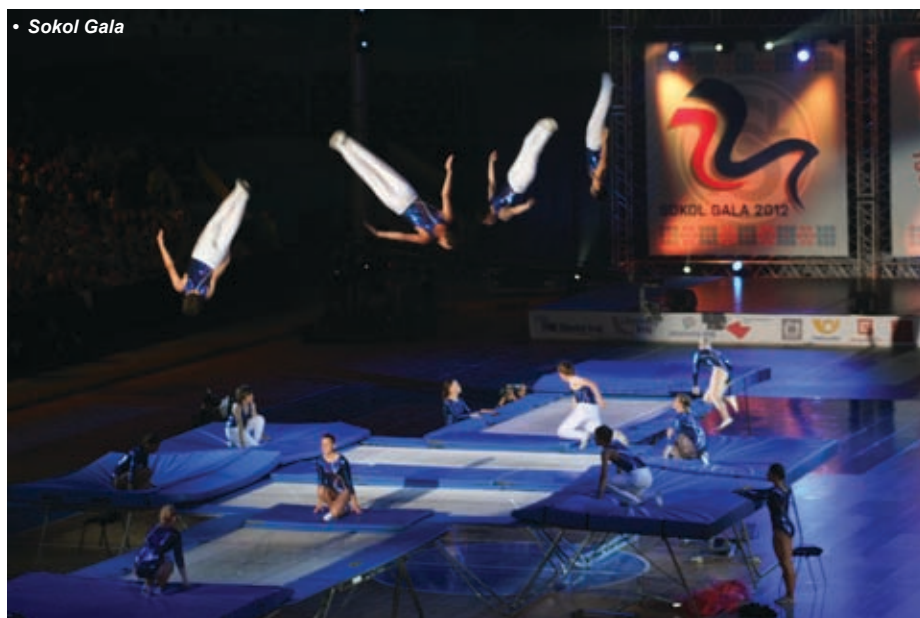
• Sokol Gala