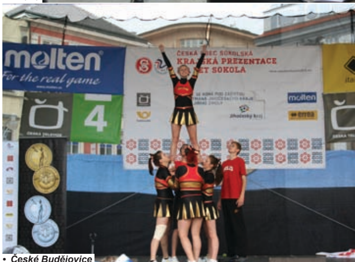
• České Budějovice