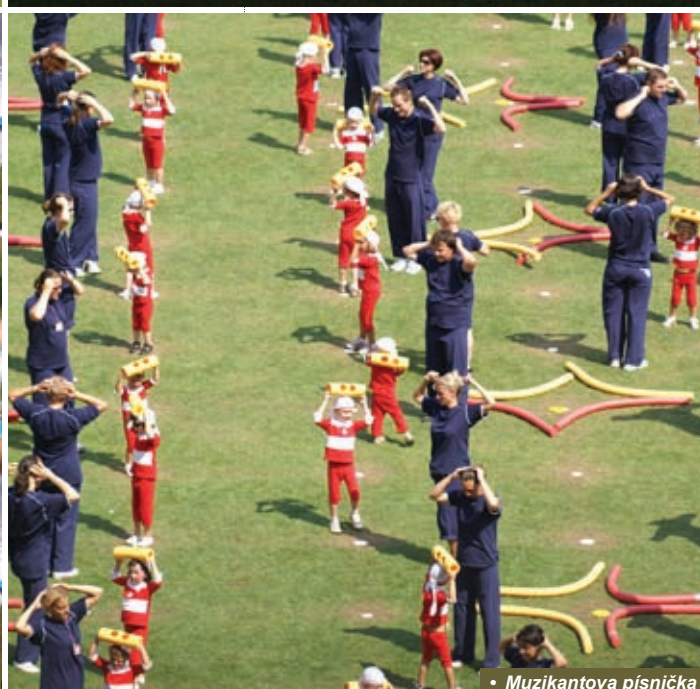
• Muzikantova písnička