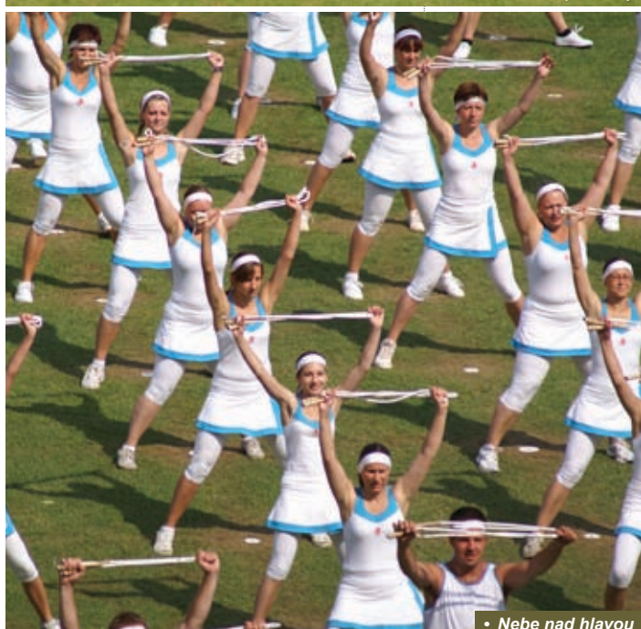
• Nebe nad hlavou