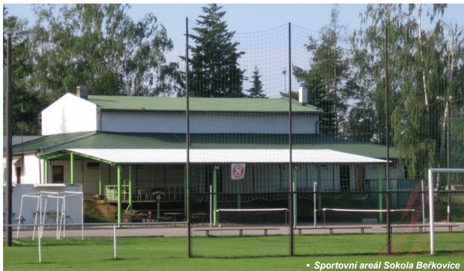
• Sportovní areál Sokola Beřkovice