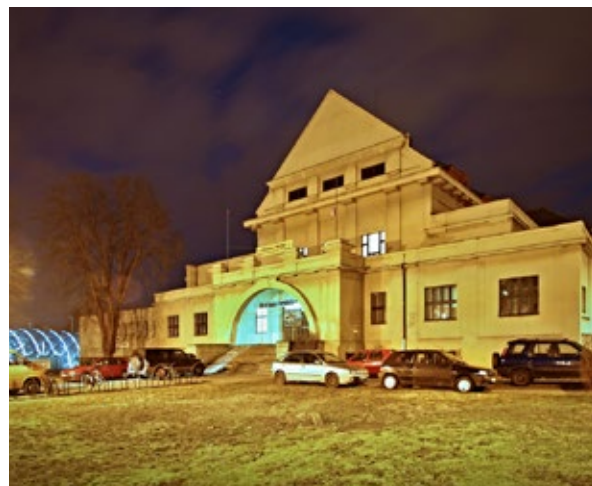
Sokolovna T.J. Sokol Pardubice I.