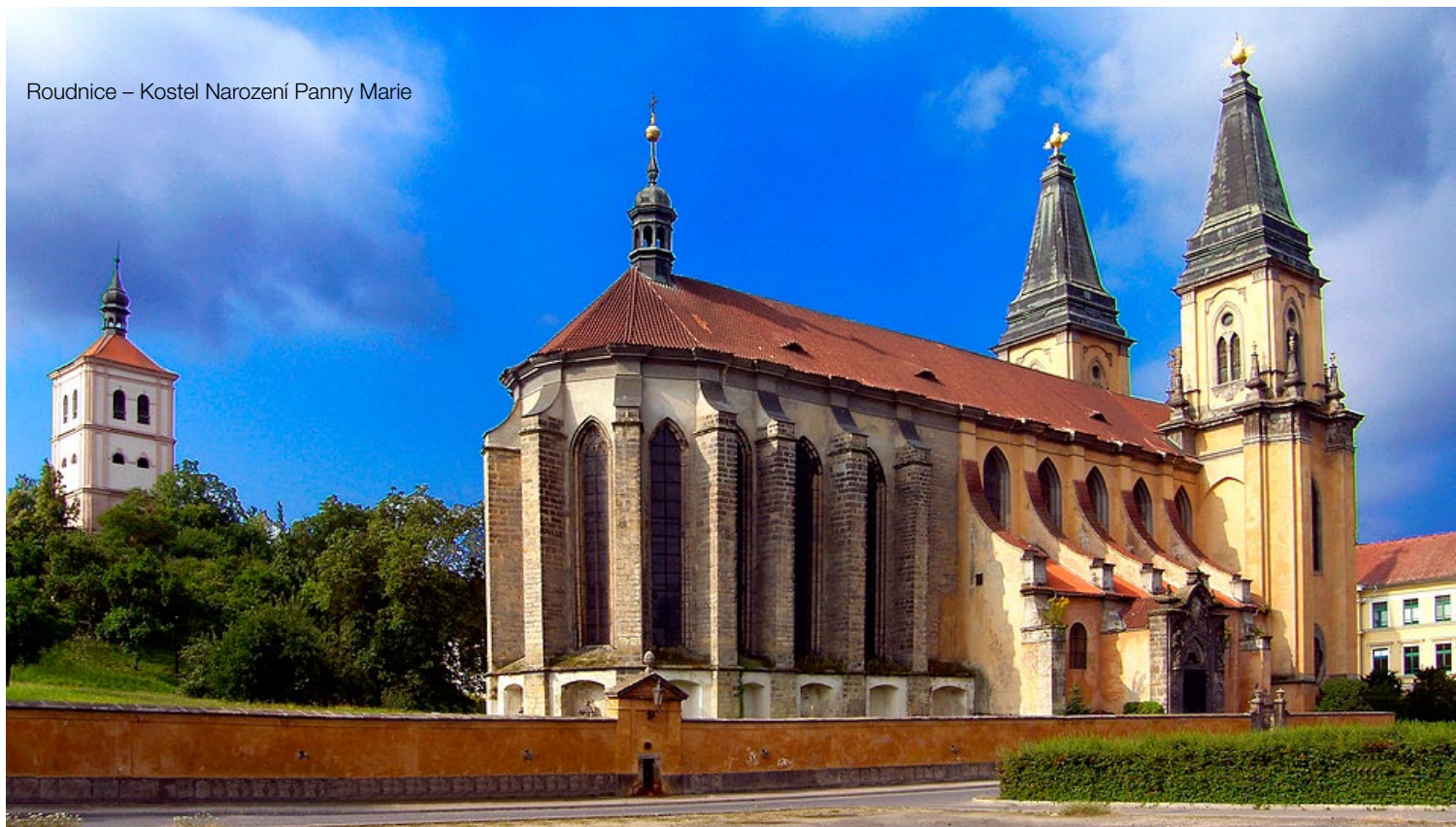
Roudnice – Kostel Narození Panny Marie

R oudnice nad Labem leží v severozápadních Čechách v Ústeckém kraji. Rozprostírá se na levém břehu řeky Labe, v úrodné Polabské nížině. Osídlování lokality dnešního Roudnicka se soustředilo od prvopočátků do blízkosti labského brodu. Zde přes řeku přecházela tzv. Lužická stezka, významná cesta z Prahy do Horní Lužice.