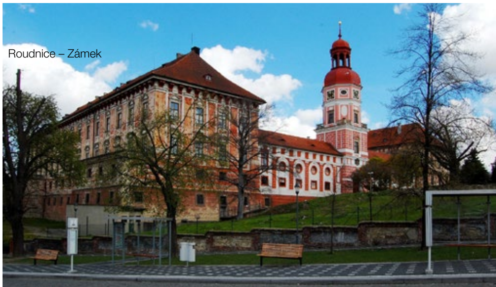
Roudnice – Zámek