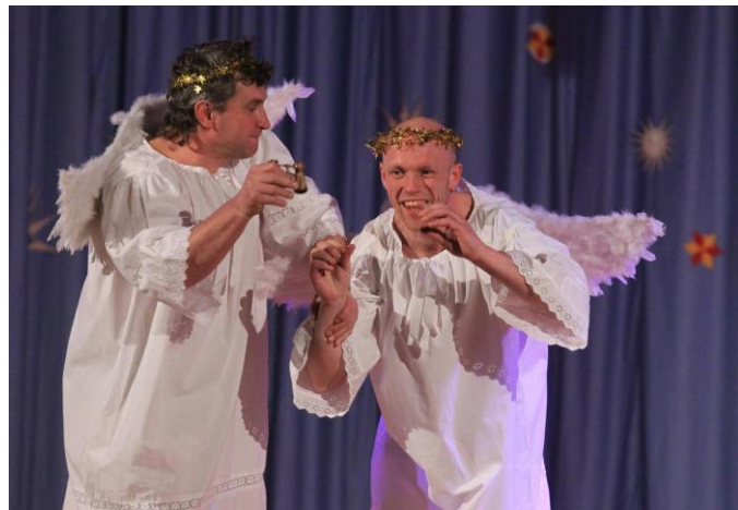
Ilustrační foto z normanského vánočního vstupu