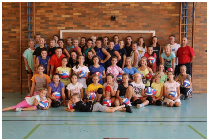
Soustředění mladých volejbalistek Sokola Pardubice I v Jablonném nad Orlicí