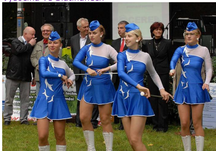
29.9.2012 Vystoupení na Svatováclavském posvícení ve Vlčnově