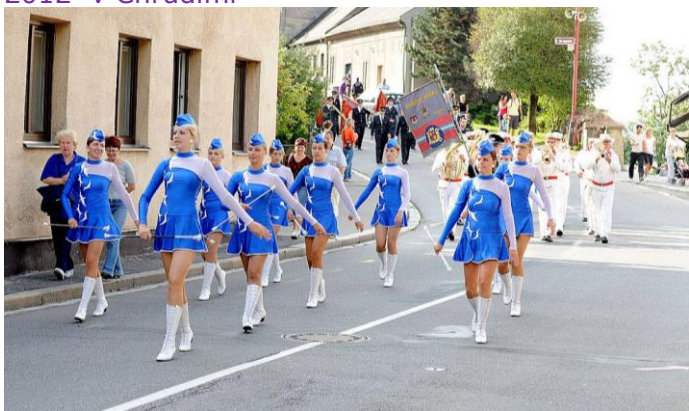
15.9.2012 Účast v průvodu a vystoupení na oslavách obce Lukavice