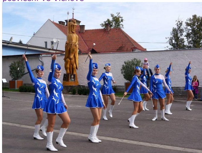
5.10.-7.10.2012 Soustředění Praha