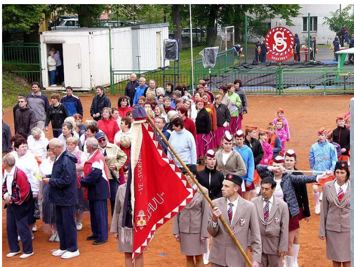
24.5.2012 Vystoupení na Bambirádě - Chrudim