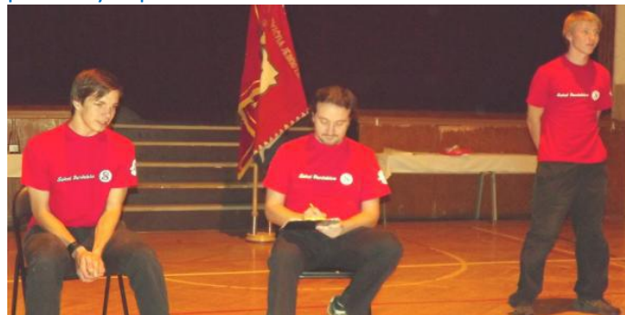
Z vystoupení divadla Exil