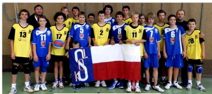
ČESKÁ TŘEBOVÁ II